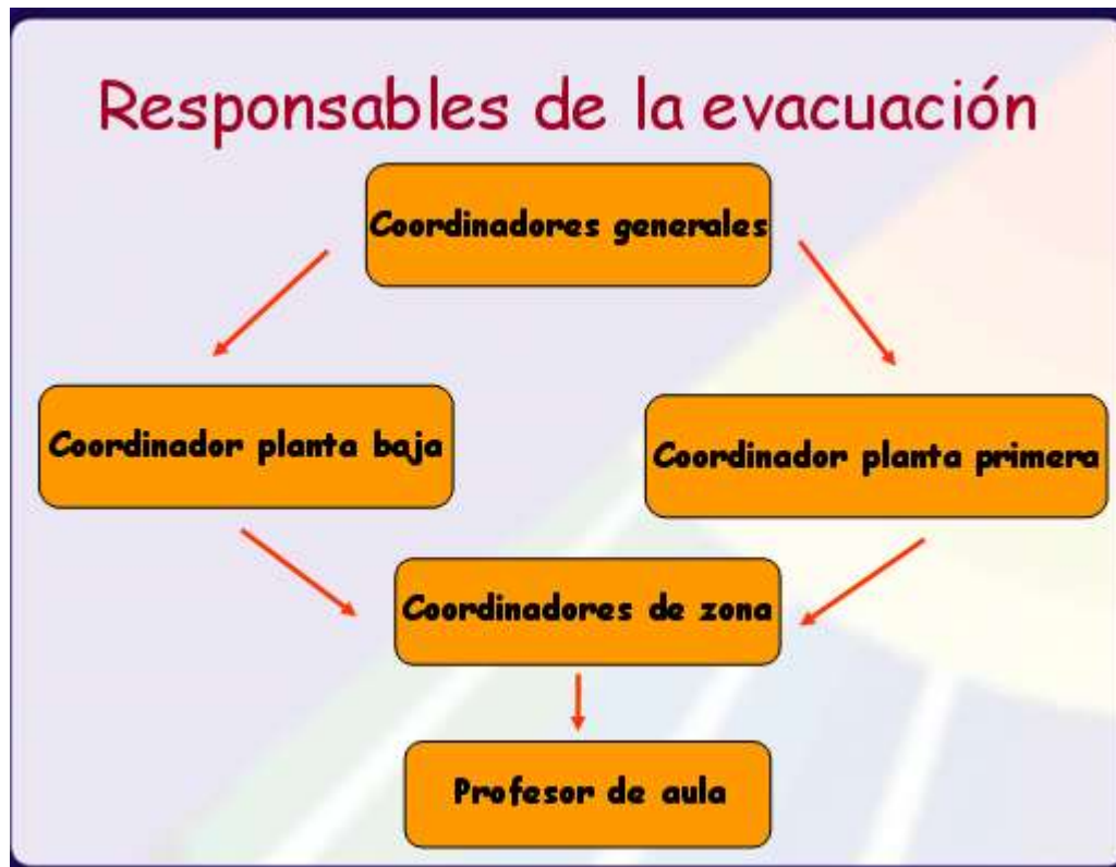
GRÁFICO DE LA DIFUSIÓN DE LA INFORMACIÓN DEL PLAN DE EMERGENCIA.

También en el primer trimestre del curso se llevará a cabo la realización de un simulacro . La finalidad del mismo es extraer la máxima información posible para determinar los puntos positivos y los aspectos mejorables del Plan de Autoprotección. Su preparación y puesta en marcha se hará por el coordinador general con la colaboración del resto de la comunidad educativa.