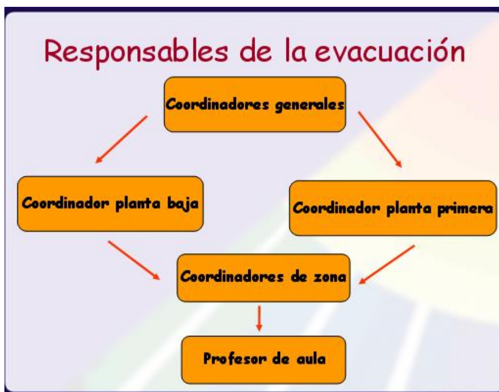
GRÁFICO DE LA DIFUSIÓN DE LA INFORMACIÓN DEL PLAN DE EMERGENCIA.

También en el primer trimestre del curso se llevará a cabo la realización de un simulacro . La finalidad del mismo es extraer la máxima información posible para determinar los puntos positivos y los aspectos mejorables del Plan de Autoprotección. Su preparación